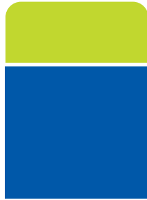
แบบประกัน ชนิดมีเงินปันผล