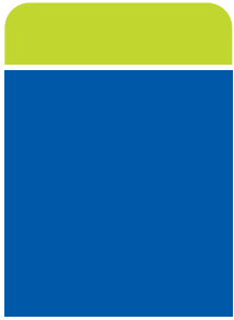
แบบประกันทั่วไป

เปรียบเทียบสัดส่วนเงินลงทุนสำหรับ แบบประกันทั่วไปและแบบประกันชนิด มีเงินปันผล